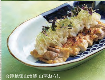
会津地鶏山塩焼 山葵おろし