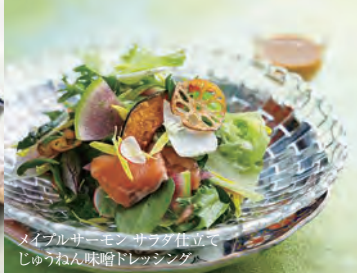
メイプルサーモンサラダ仕立て じゅうねん味噌ドレッシング