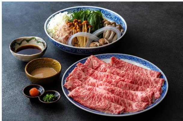
▲「しゃぶしゃぶコース（2名様分）」イメージ