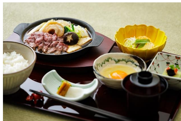
▲「桜肉のすき焼御膳」イメージ

ディナーでご好評いただいている黒毛和牛のしゃぶしゃぶをランチに最適なボリュームで提供いたします。肉の旨みと野菜の甘みが溶け込んだ出汁は、最後の一口までその余韻をお楽しみください。