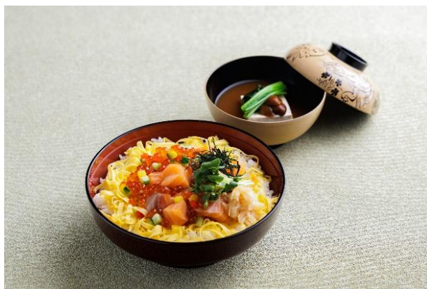
▲「はらこ飯平川風」イメージ