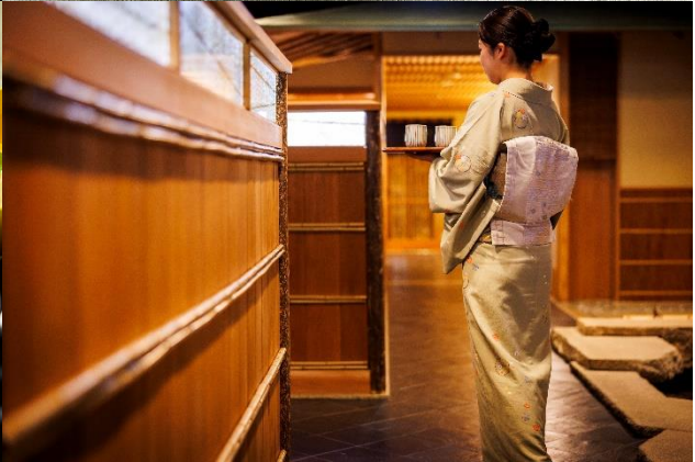
▲平川「ゴールデンウィーク限定ランチメニュー」イメージ