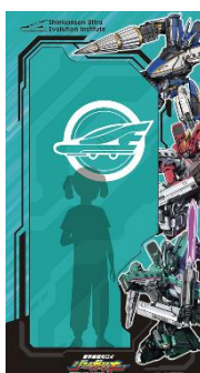
フォトスポットイメージ