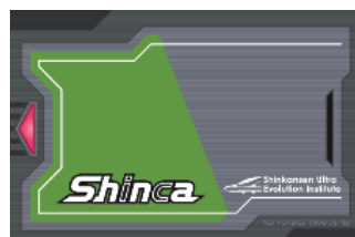
ルームキーイメージ

この報道資料は、ときわクラブ、丸の内記者クラブ、JR記者クラブにご案内しています。