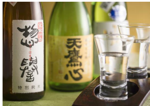
「栃木の地酒 利き酒セット」イメージ写真 ▲