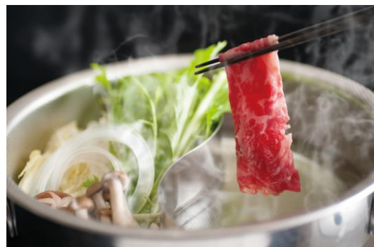
「とちぎ和牛のしゃぶしゃぶ」イメージ写真 ▲