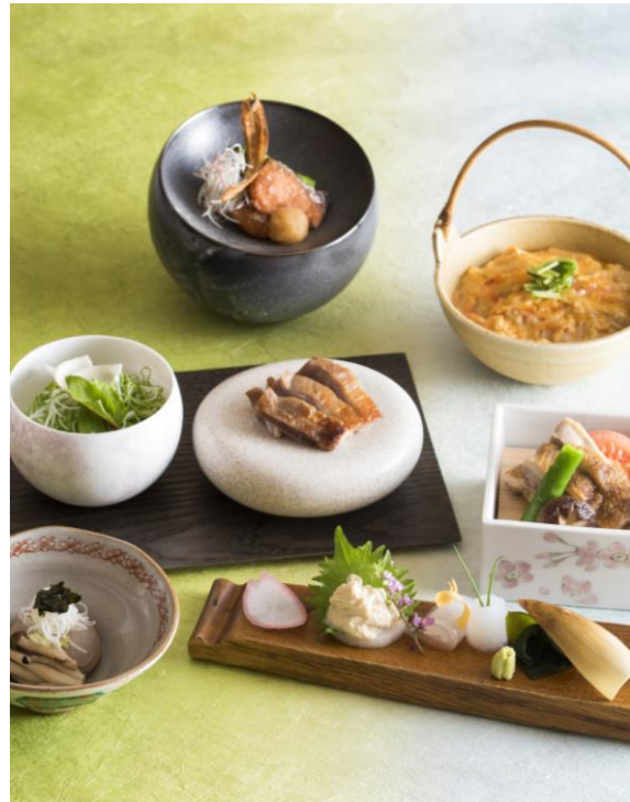
「おすすめ逸品」イメージ写真 ▲