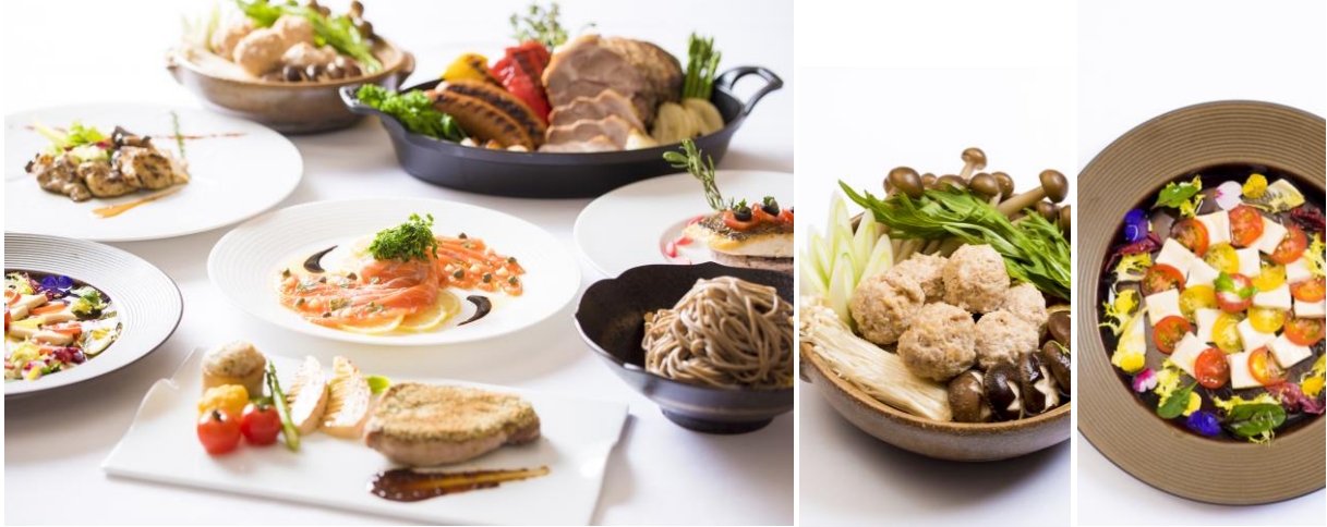
「ディナーbuffet」イメージ写真 ▲

栃木県産豚肩ロースの香草パン粉焼や、「美しゃも」のつみれ鍋、寄せ湯波のモッツアレラ風、「プレミアムヤシオマス」のマリネサラダなど、栃木の確かな食材とシェフのインスピレーションが融合した料理をお楽しみいただけます。