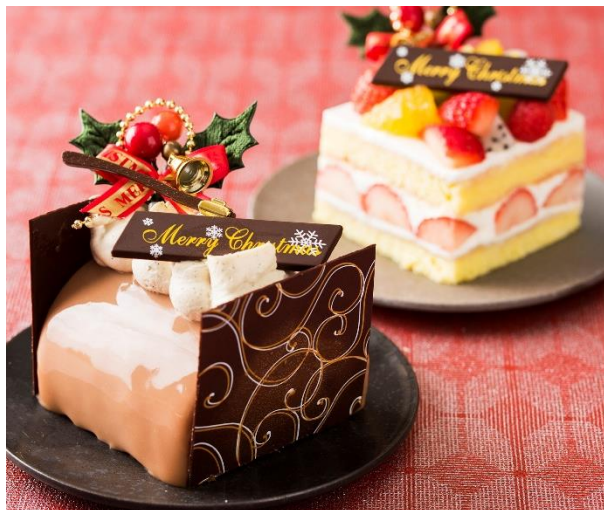
▲パティシエ特製クリスマスケーキ

クリスマスの夜を彩る、パティシエ特製のクリスマスケーキを1部屋につき1つお付けした特別宿泊プランです。色鮮やかなフルーツをちりばめた「いちごのショート」と、紅茶の香りが広がる「ノエル アールグレイ」の2種類からお選びいただけます。