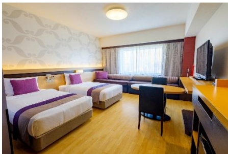
▲客室「イーストウィングファミリー」明るい色調で、バブルバス付きの広々バスルームが特徴。ご家族のご利用に最適です。