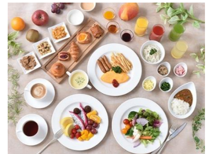
▲約60種類のメニューが並ぶ、ブッフェスタイルの朝食