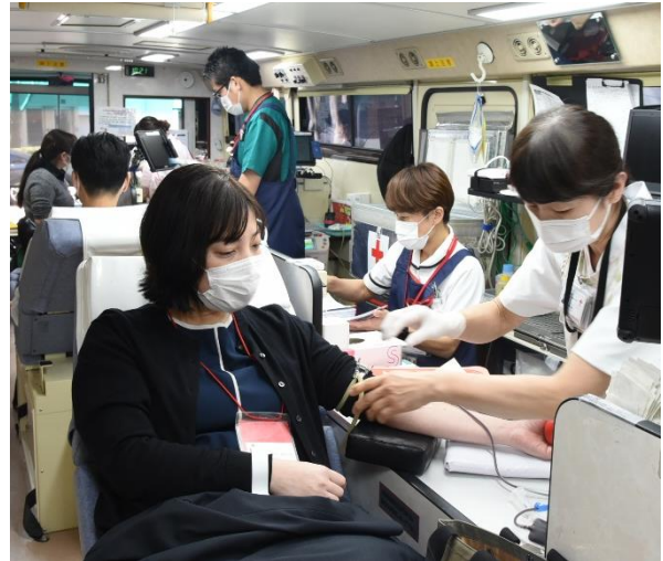
昨年の献血活動の様子（2023年2月6日）▲