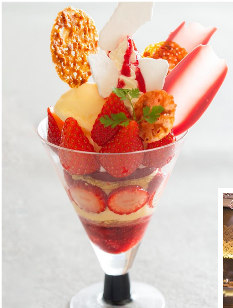
▲ いちごパフェ イメージ写真

ホテルメトロポリタン エドモント（所在地／千代田区飯田橋、総支配人／松田秀明）のダイニング・カフェ「ベルテンポ」では、2024年3月1日（金）～3月31日（日）の期間限定で、旬のいちごをふんだんに使ったパフェをティータイムに提供いたします。レストラン内を桜で装飾したお花見仕様の空間で、春をご満喫いただけます。